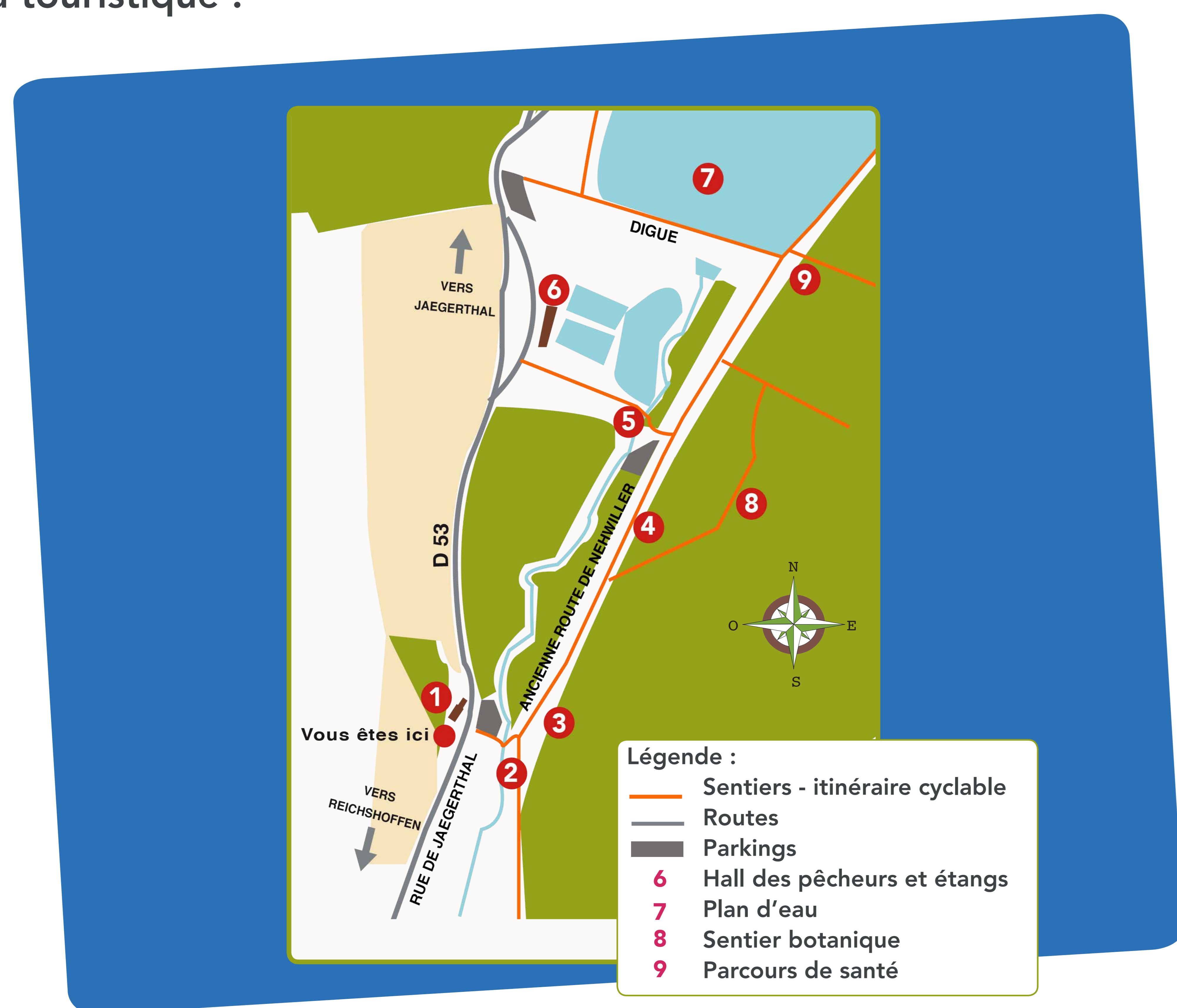
Schéma touristique :