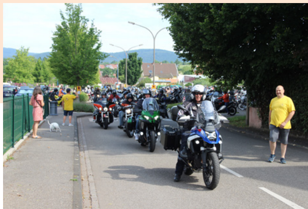
Fête de la Moto - 20 juillet