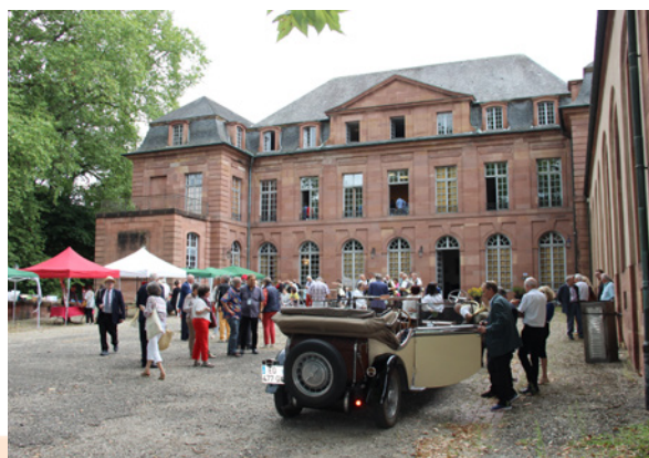
Congrès des Alsaciens du Monde - 22 et 23 août