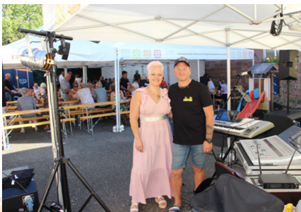
Fête d'été à Nehwiller - 9 août