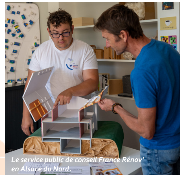
Le service public de conseil France Rénov' en Alsace du Nord.

Retrouvez la synthèse du bilan à mi-parcours et toutes les informations du plan climat de l'Alsace du Nord sur agireensemble.alsacedunord.fr