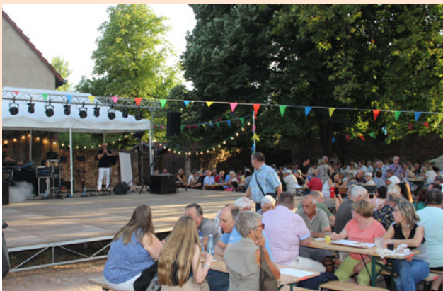
Bal Populaire - 12 juillet