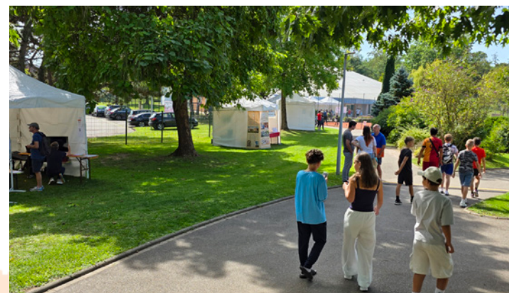
Portes ouvertes des associations - 7 septembre