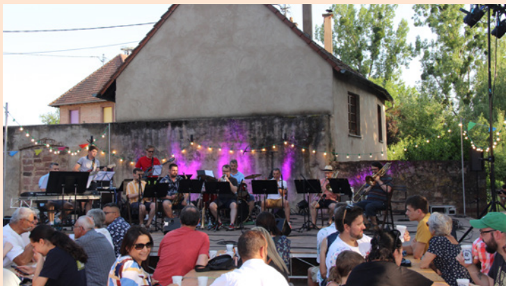
Fête de la Musique - 21 juin