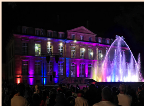
Reichshoffen en Fête - 5 et 6 juillet