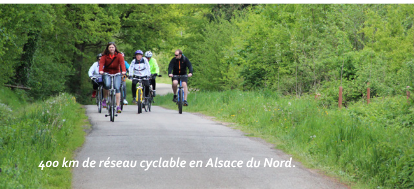
400 km de réseau cyclable en Alsace du Nord.