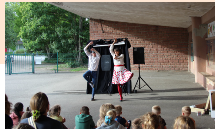
Spectacle décentralisé Mômes en Scène - 2 août