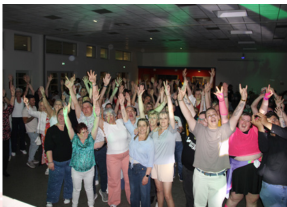
Soirée Années 80 et 90 du FCER - 17 mai