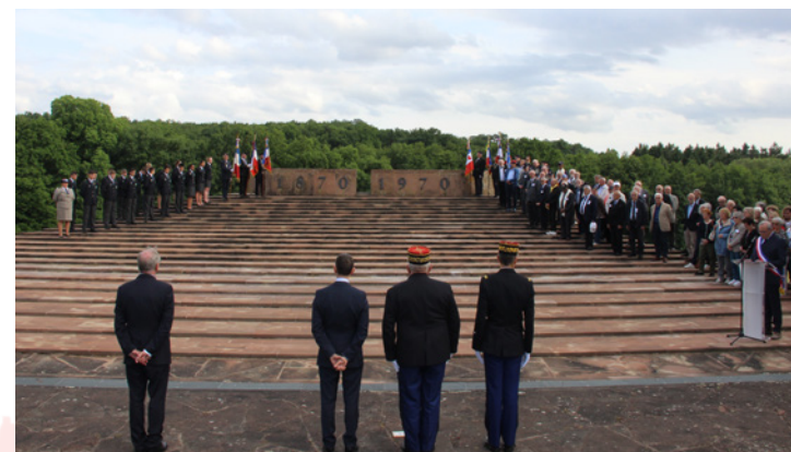
Cérémonie de l'Association des Enfants de Troupe - 3 juin