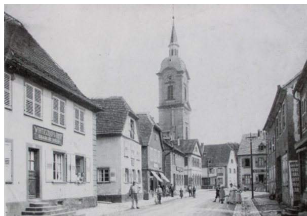
Rue des Vosges vers 1900 (actuelle rue du Général de Gaulle).