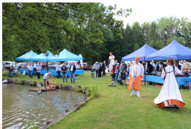
Flâneries autour du Plan d'eau - 18 mai