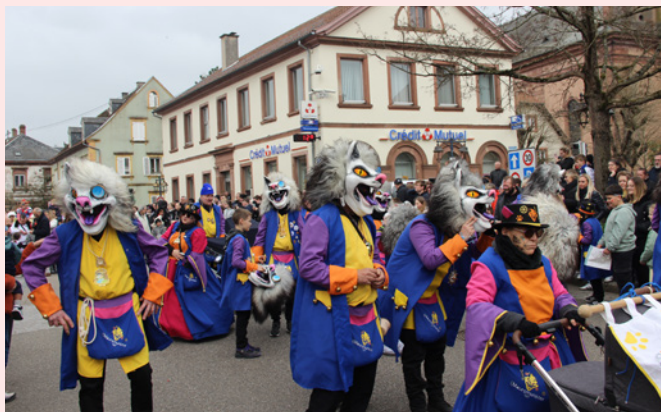
Cavalcade du Carnaval - 30 mars