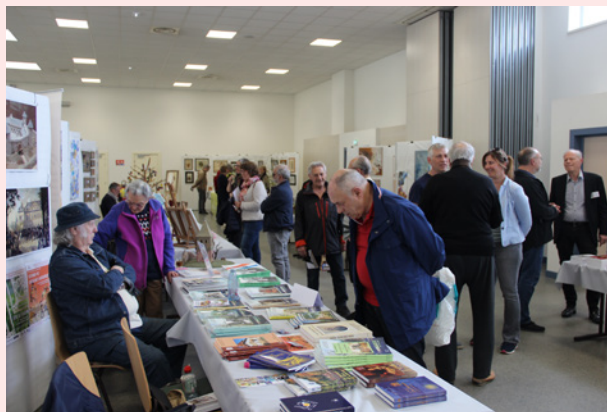
Reich'Art - du 19 au 21 avril