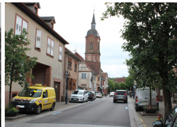
Photo actuelle de la même rue.