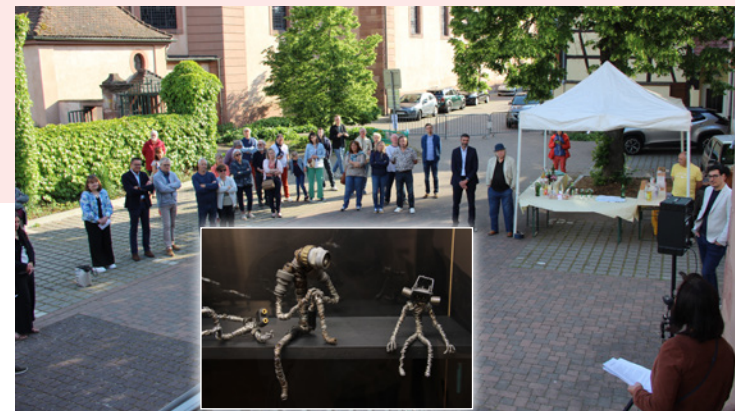
Musée Historique et Industriel / Vernissage - 17 mai