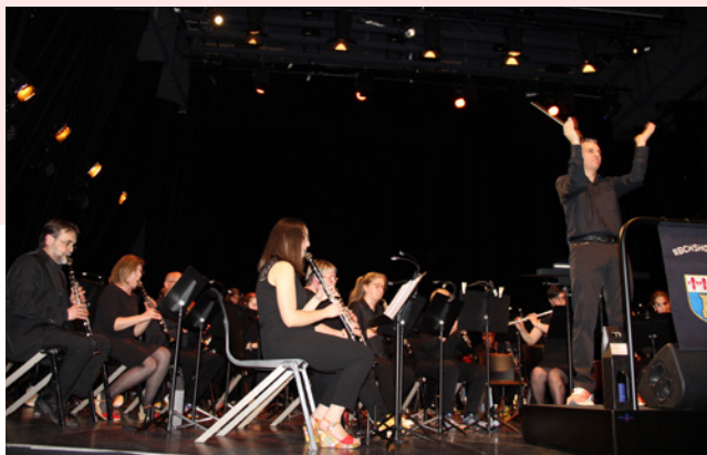
Concert de Printemps / Musique Municipale - 26 avril