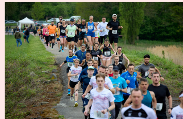
Course de Printemps - 26 avril