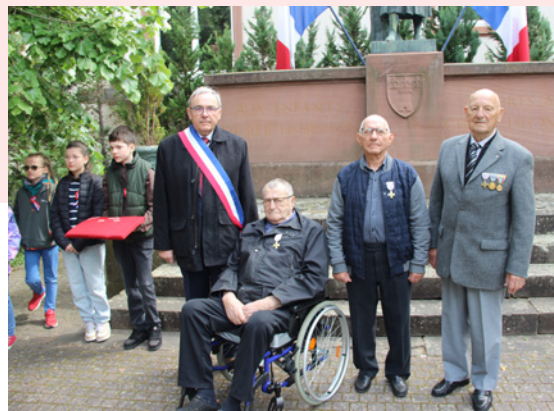
Cérémonie Commémorative du 8 mai